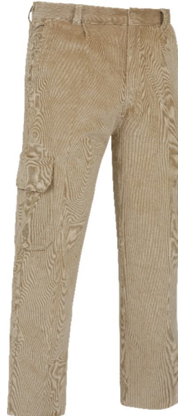
REF. PANA-BE Color ■ Beige