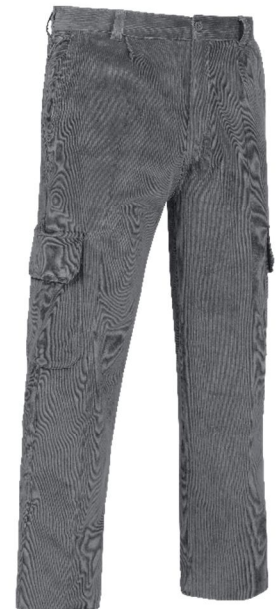
REF. PANA-GR Color ■ Gris