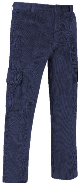
REF. PANA-AM Color ■ Marino