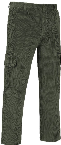
REF. PANA-VE Color ■ Verde